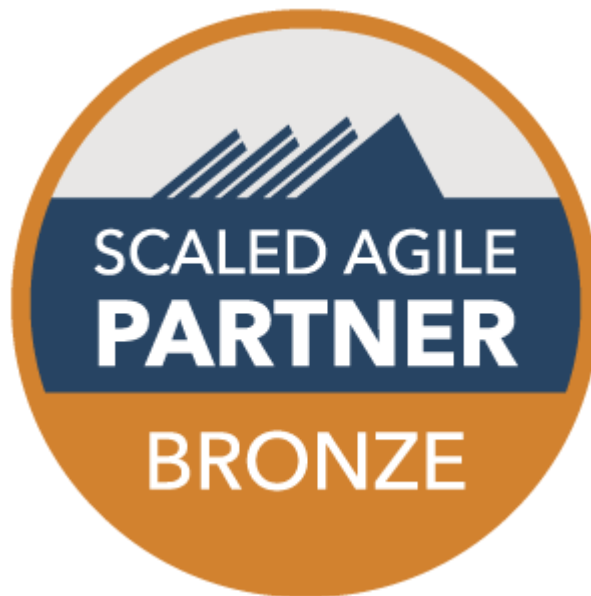
Bildunterschrift: Method Park ist Scaled Agile Bronze Transformation Partner.