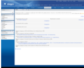
Risk Management (FDA)