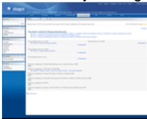
Quality Management (FDA)