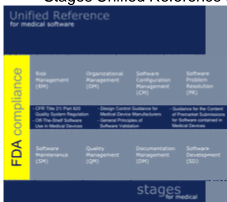
Stages Unified Reference EU (UR.EU)